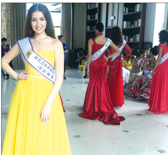
Дни участниц конкурса были расписаны буквально по минутам.