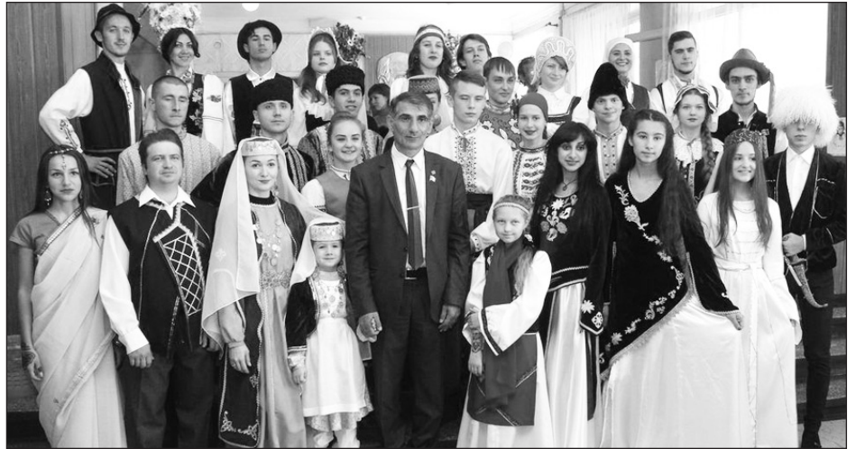
На недавнем фестивале национальных культур в ДК им. Шевченко мелитопольцы продемонстрировали: МЫ ВМЕСТЕ!

Теперь о том, кто такие мы - инициаторы проекта. Состав партнеров определила