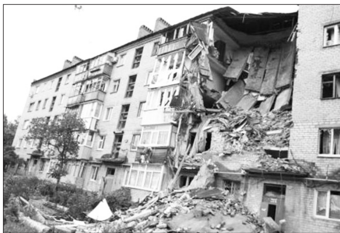
В такой Луганск возвращаться страшно.