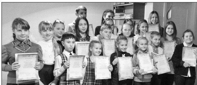
20 участников получили грамоты и подарки.

Дети получили благодарности и подарки от управления